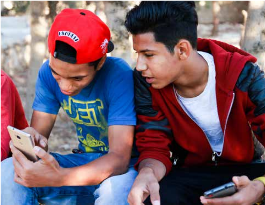
De kinderen en jongeren kunnen de stress en spanning van hun vlucht stilaan vergeten

matig klachten over de hygiëne van veel jongens. In de omstandigheden waarin ze opgegroeid zijn, was dat gewoon niet aan de orde. Nu komen ze zelf naar ons als hun tandpasta of zeep op is.